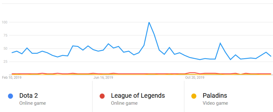
Gambar 2. Hasil Google Trend dalam kategori Games