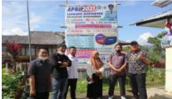
Gambar 1. Survey dan Wawancara

Berdasarkan hasil mengidentifikasi dan merumuskan masalah diatas, maka metode pendekatan yang ditawarkan untuk mendukung realisasi program PkM Lektor Fakultas Ilmu Komputer UMI Pada Optimalisasi Web Sumber Daya Lokal untuk Pengembangan Potensi Desa pada Lembang Marinding Desa Kandora Kecamatan Mangkendek Kab.Tana Toraja yaitu (1) metode tanya jawab/diskusi (2) Metode ceramah/Presentasi, dan (3) Metode latihan