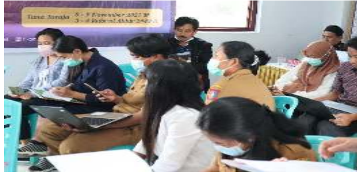
Gambar 6. Mengakses Website Desa