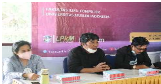
Gambar 3. Sosialisasi Website

Program PkM Lektor Fakultas Ilmu Komputer UMI di daerah dataran tinggi ini bertujuan mendorong perkembangan mutu kualitas aparatur desa sehingga mampu menjalankan program pengembangan sistem informasi Optimalisasi Web Sumber Daya Lokal untuk Pengembangan Potensi Desa pada Lembang Marinding Desa Kandora Kecamatan Mangkendek Kab.Tana Toraja secara efisien dan efektif serta menjadikan masyarakat lebih sejahtera dan lebih baik. Kegiatan pokoknya mencakupi: