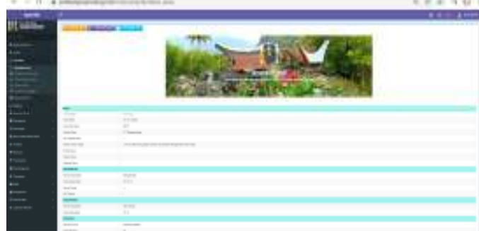
Gambar 8. Tampilan Website

Mewujudkan Lembang Marinding menuju Lembang Marinding andalan di kabupaten Tana Toraja dan sejajar dengan kelurahan lainnya di Sulawesi Selatan dalam mensejahterakan masyarakat lahir dan batin.