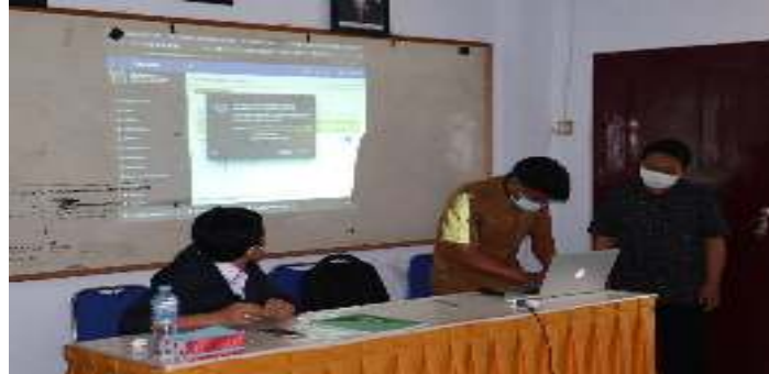
Gambar 7. Mengolah Website