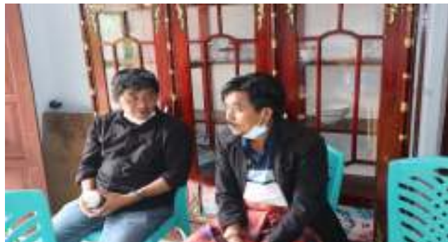
Gambar 2. Observasi Lapangan

Dilaksanakan pada tanggal 19 Oktober 2021 di tempat Lembang Marinding dengan tujuan membuat dokumentasi permasalahan kondisi desa Lembang Marinding serta melihat kondisi lokasi pengabdian.