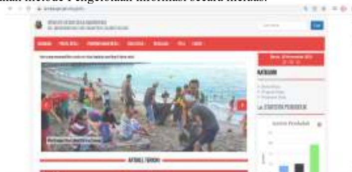
Gambar 5. Web Desa Lembang Marinding