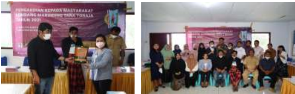
Gambar 4. Implementasi