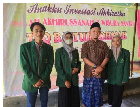
Gambar 1. Dokumentasi Pengurus Harian dan Kepala TPQ Baiturrohmah