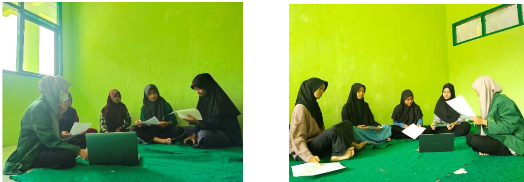
Gambar. 2 Kegiatan Diskusi dan Tanya Jawab